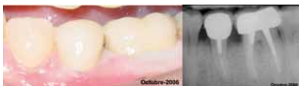
Fig. 7.- Imágenes clínica y radiográfica del resultado final.