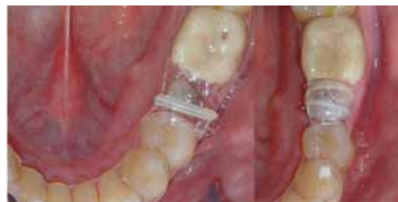
Fig. 3.- Se instruye al paciente para que se enganche la goma en el dobléz lingual de la percha, que se coloque el essix y luego pase la goma por encima hacia el gancho vestibular.