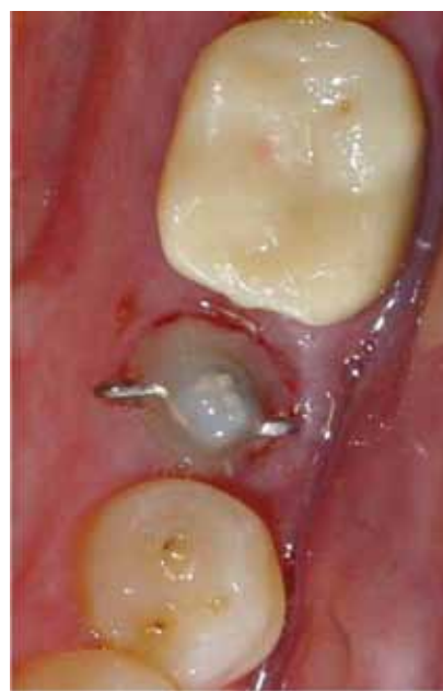
Fig. 2.- Se introduce el helix de la percha en la cabeza del perno y se fija con composite fluido, tras haber grabado la dentina y usado adhesivo dentinario.