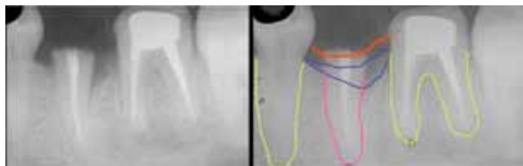
Fig. 4.- Rx antes de colocar el perno intrarradicar. La línea roja marca el margen gingival. Las líneas azules marcan los niveles óseos. Obsérvese los ápices radiculares del 35 y de los dientes vecinos.