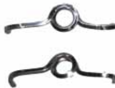
Fig.1.- Se conforma con alambre de 0,016 x 0,016 de acero una percha con un helix central del que salen dos brazos, uno hacia lingual y otro hacia vestibular con un dobléz hacia gingival.