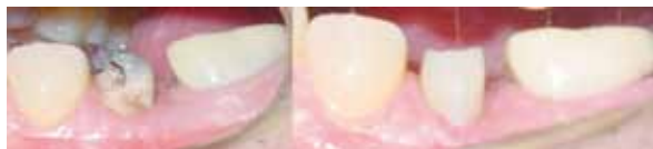
Fig. 6.- Imágenes clínicas del muñón extruido antes de retirar la percha y una vez preparado y tallado para su posterior reconstrucción protésica.