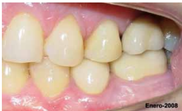
Fig. 8.- Imagen clínica del resultado al cabo de 16 meses post-tratamiento.